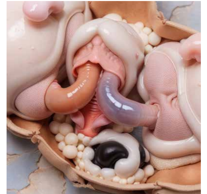
Placenta Shake: „Pains and Penalties (II)“, promptography, co-created using Comfy UI with Stable Diffusion 1.5, 2024

Der deutsche Künstler Boris Eldagsen gilt als einer der bekanntesten Namen im Feld der KI-Kunst. Seine Bilder wirken wie alte Fotografien oder Filmszenen, die nie existierten, aber aus kollektiven Träumen entnommen scheinen. Er beschreibt seine Methode als „Stuntman des Unbewussten“: Er zwingt die KI, ihm Bilder zu zeigen, die er nicht sehen will. Seine Werke haben die Intensität von Geständnissen, flüsternd durch Rauschen übermittelt.