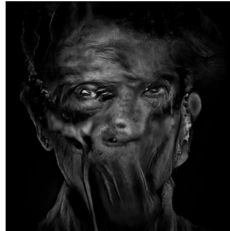
Rashed Haq: "Human Trials | Trial 5P7.2", promptography, generated with a custom neural network GAN architecture, 2020

Roger Ballen: „KI verändert die Fotografie und viele andere Bereiche und wirft drängende kreative wie auch ethische Fragen auf. Deshalb starten wir mit dieser Ausstellung. Wir wollen uns diesen Themen direkt stellen – und von Anfang an einen Ton der Relevanz und Reflexion setzen.“ Die ausgewählten Künstlerinnen und Künstler eint der Wille, das Unheimliche, Absurde und Verstörende sichtbar zu machen. Statt Hochglanzbildern entstehen Bildwelten, die verdrängte Aspekte des Selbst aufrufen und die Betrachter mit ihrem eigenen Unbewussten konfrontieren.