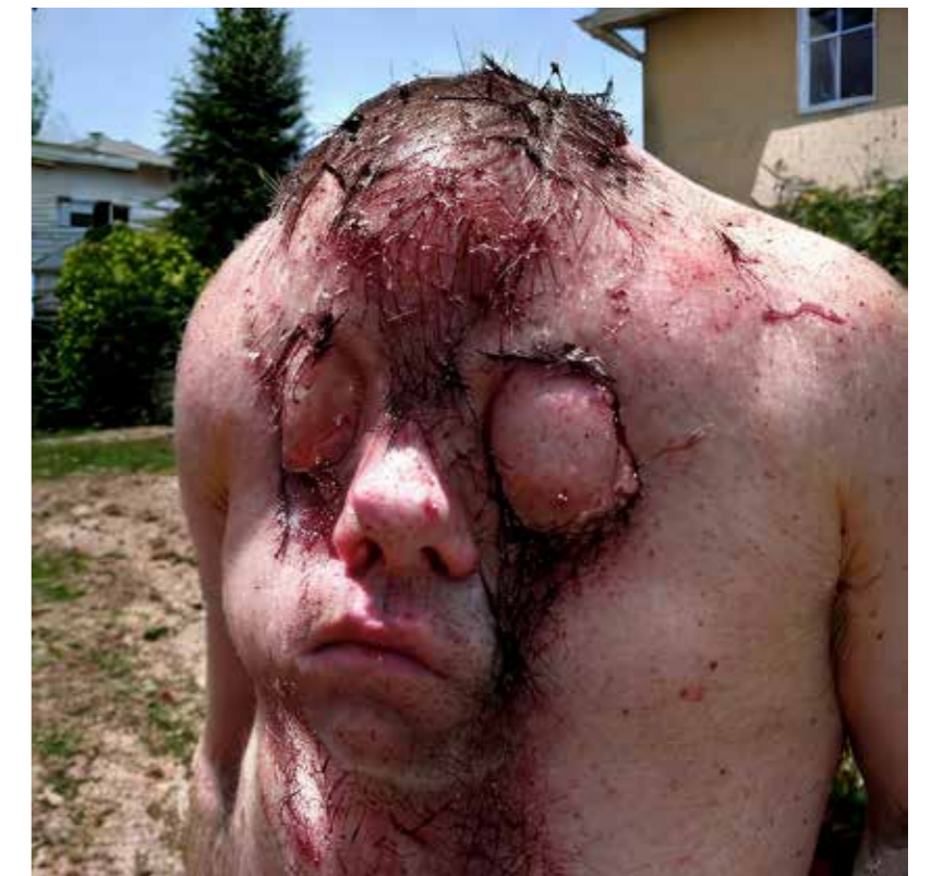
Ian Haig: "Human contagions (I)", promptography, created with Stable Diffusion, 2025