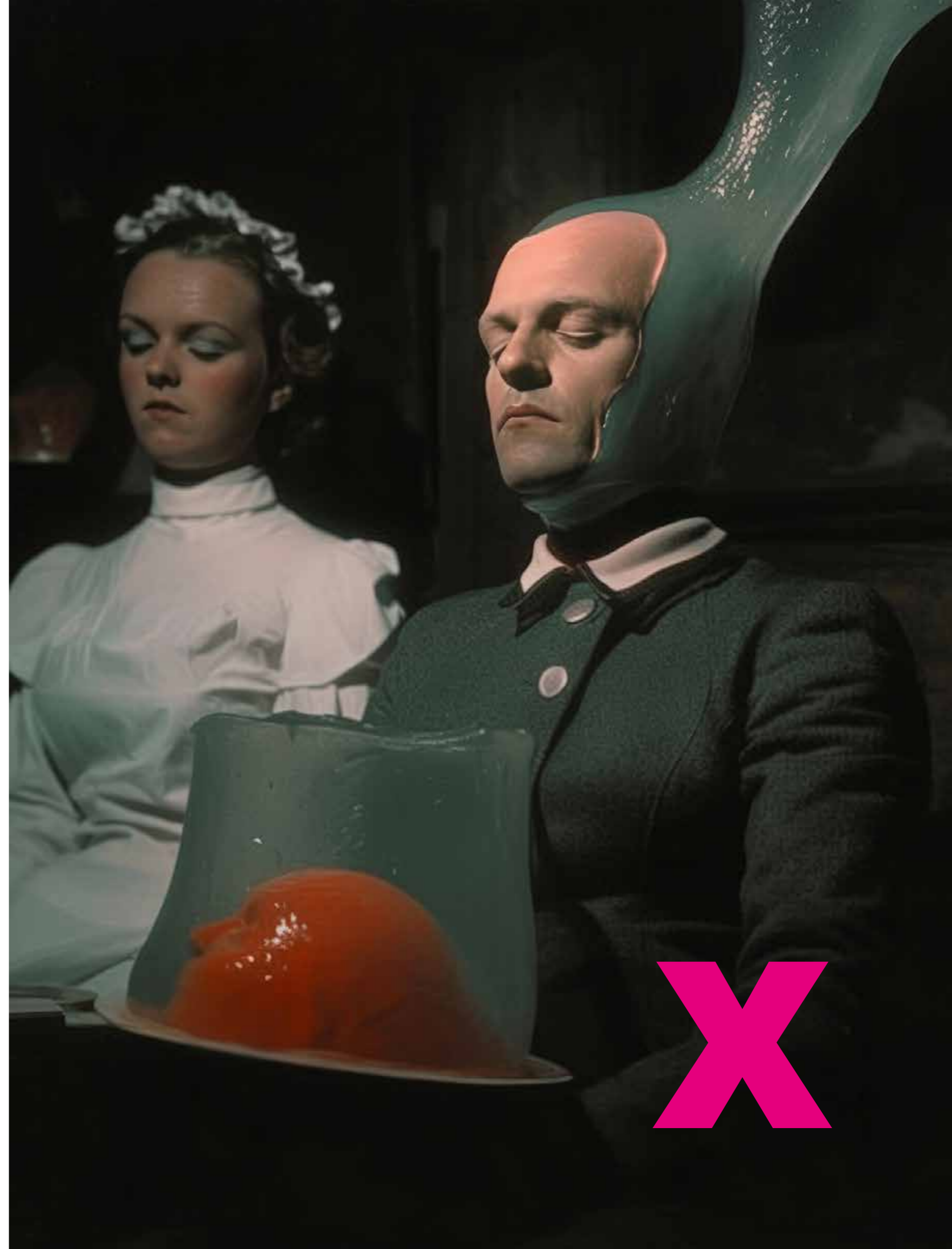
Roeland Heijne aka monstrwithin: "The Nacht Offer", promptography, co-created using Midjourney niji 6, 2025

Monstrwithin alias Roeland Heijne aus den Niederlanden kombiniert seine Erfahrung als Maler mit KI. Seine Werke zeigen maskierte, märchenhafte Figuren, die an Illustrationen erinnern und zugleich beunruhigend wirken. Mit reicher Farbgestaltung und ausgewogener Komposition gelingt es ihm, ästhetischen Genuss und psychische Irritation zu verbinden. Die „Monster“ sind Metaphern innerer Zustände, die zwischen Schönheit und Bedrohung oszillieren.