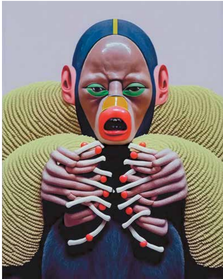
Arminda da Silva aka ImagineThat: "Overwhelmed, Overgrown", promptography, co-created using Midjourney, 2025